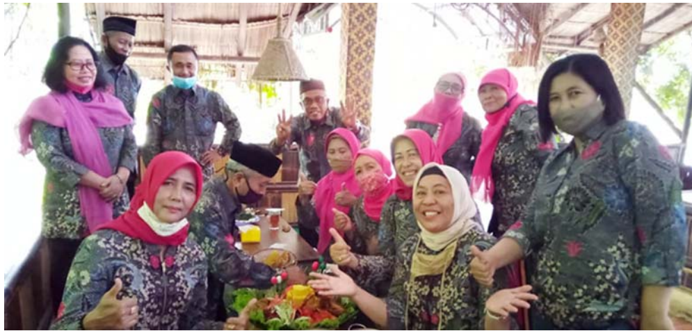
Tumpengan Intan Sejati Pengda Ponorogo pada peringatan HUT Intan Sejati ke 34 Tahun 2021