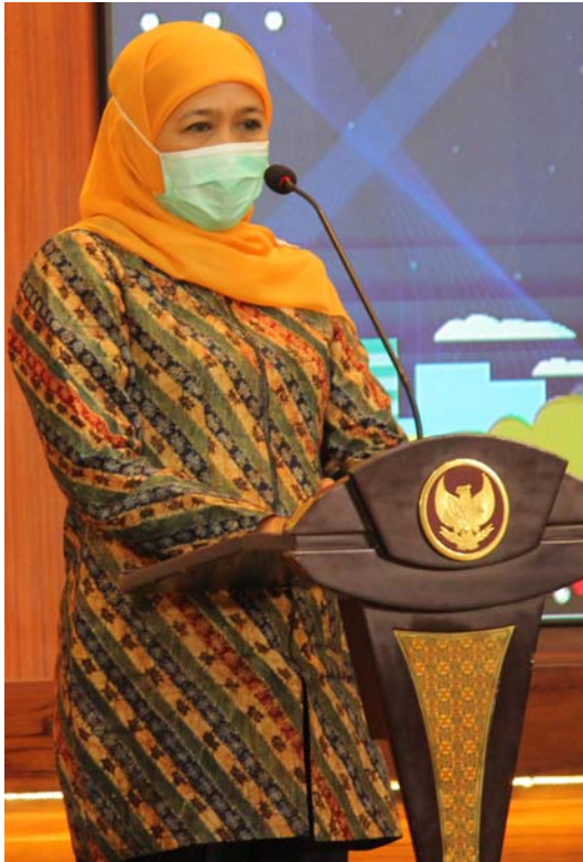
Gubernur Jawa Timur Khofifah Indar Parawansa

Gubernur Khofifah menyampaikan apresiasi atas inovasi yang telah dilakukan Bapenda Jatim. Menurutnya, Bapenda Jatim telah mampu meningkatkan kinerjanya dengan berinovasi serta selalu mengupdate teknologi untuk pelayanan kepada masyarakat. Selain itu, pencapaian kinerja Bapenda dari tahun ke tahun mampu melebihi target.