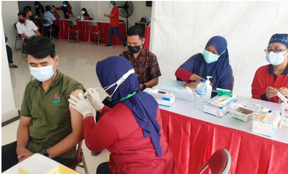
Ilustrasi. Proses vaksinasi Covid-19 di RSUD dr. Soewandi Surabaya

Pandemi virus corona telah memasuki tahun kedua di Indonesia, yang belum menunjukkan tanda-tanda akan berakhir. Berbagai upaya telah dilakukan pemerintah bersama masyarakat, untuk memutus mata rantai penyebaran Covid-19, yaitu melalui gerakan memakai masker, mencuci tangan menggunakan sabun, menjaga jarak, menjauhi kerumunan, serta mengurangi aktivitas di luar rumah.