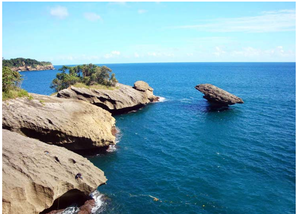
Pantai Popoh terjaga kebersihannya, karena Pemerintah Kabupaten Tulungagung bersama masyarakat terus merawat kebersihannya.

Pantai menawan di Tulungagung ini menyimpan daya tarik lain yang sarat akan