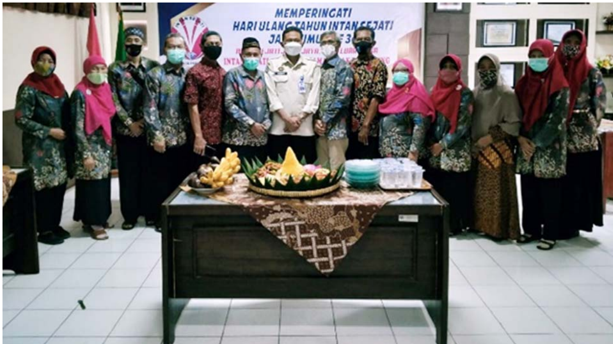
Tumpengan Intan Sejati Pengda Gresik pada peringatan HUT Intan Sejati ke 34 Tahun 2021