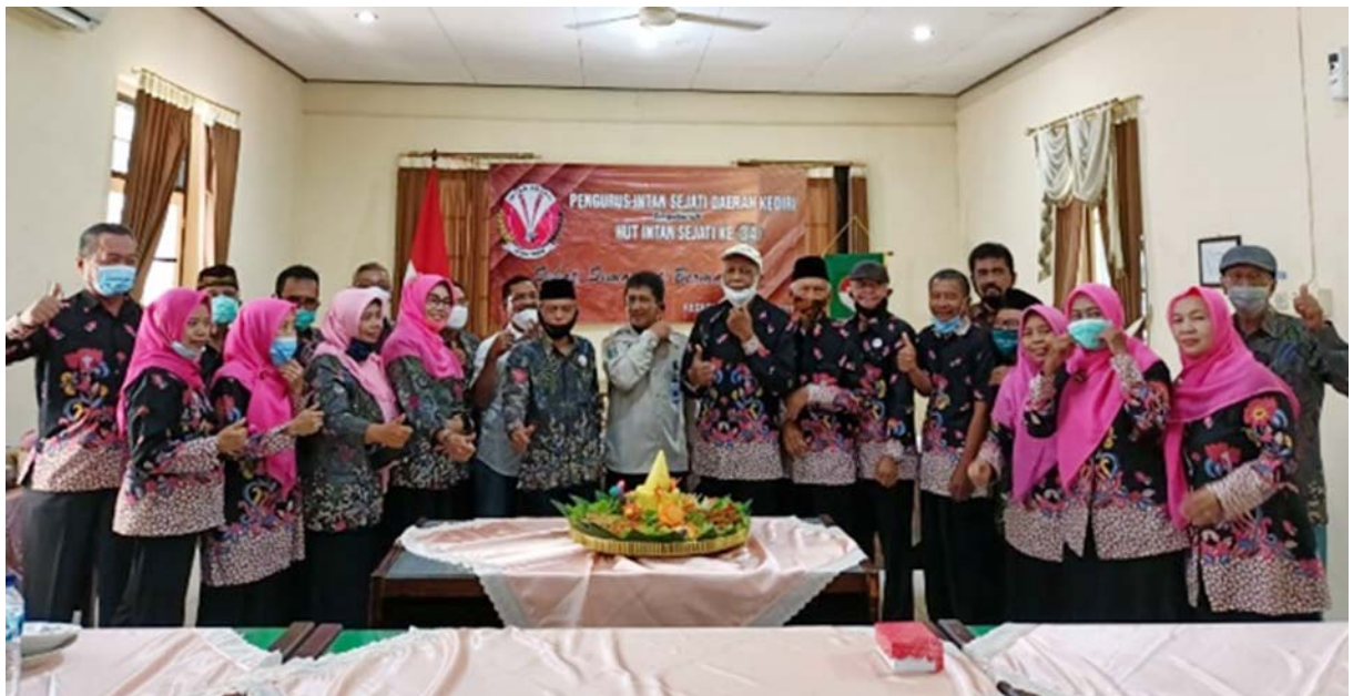
Tumpengan Intan Sejati Pengda Kediri pada peringatan HUT Intan Sejati ke 34 Tahun 2021

Banyuwangi, Kediri Ponorogo dan lainnya melaksanakan pertemuan anggota dengan ditandai tumpengan dengan jumlah peserta tidak lebih 25 orang.