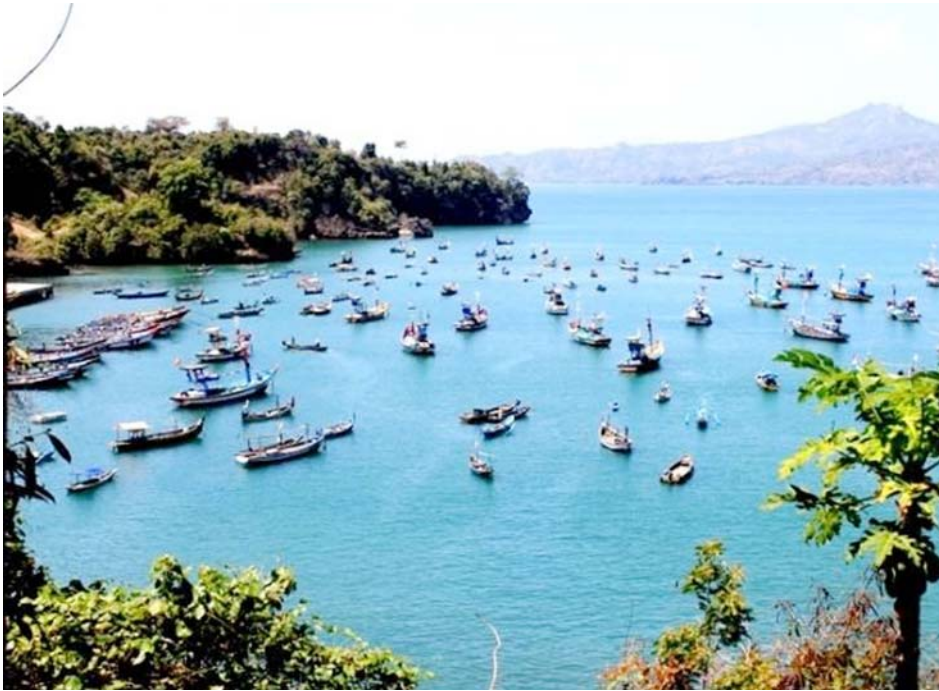
Daya tarik lain dari pantai ini terdapat wisata tebing. Lokasinya di bagian Barat dan Timur Pantai Popoh.

nal dan belajar sejarah kuno dari makam kuno ini. Selain menyimpan cerita bersejarah, makam juga menyimpan sesuatu yang terkesan mistis. Adanya makam di sekitaran area wisata pantai membuatnya sering dikaitkan dengan cerita-cerita mistis yang dipercaya oleh warga sekitar sebagai cerita nyata.