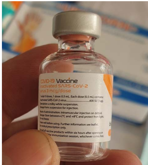
Vaksin Covid-19 yang diterima masyarakat

“Prinsipnya kalau terjadi gejala tidak perlu obat atau suplemen khusus, karena akan hilang dengan sendirinya. Selain itu, reaksi itu juga bergantung dari penerima vaksin. Tapi, prinsipnya tidak perlu takut vaksin karena ini aman,” tandas Roberto. (AP-11)